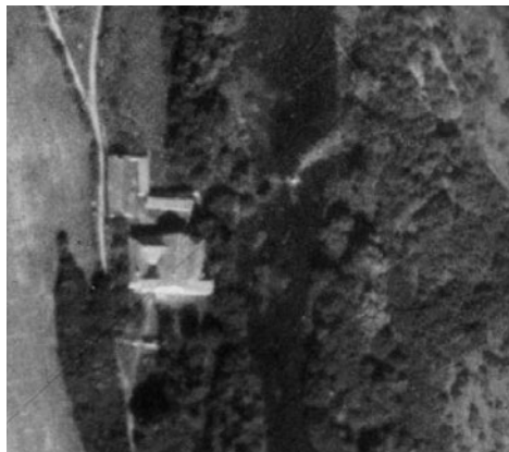
Vojenské letecké mapování, 1952-1953.