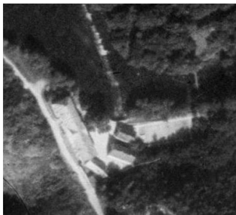
Vojenské letecké mapování, 1952-1953.