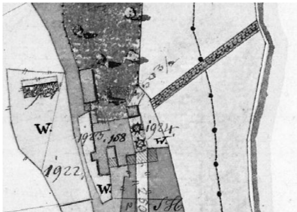
Povinný otisk Stabliního katastru, polovina 19. století.