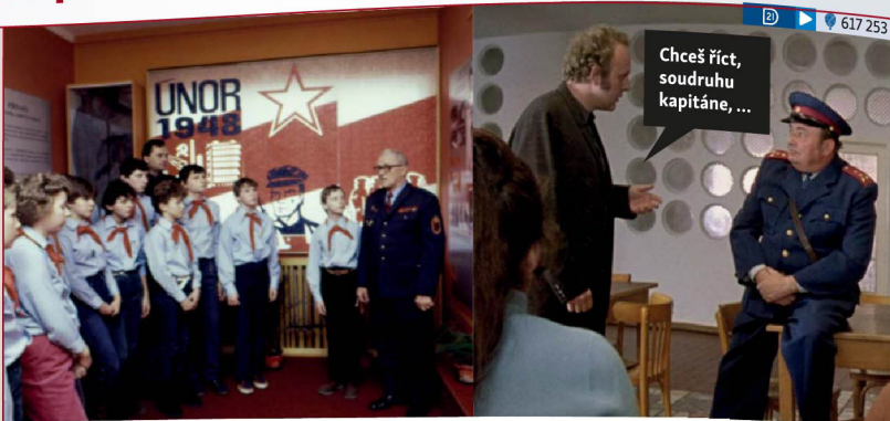
Příslušníci jednotky Lidových milicí v n. p. JAWA Týnec nad Sázavou pořádají časté besedy s dětmi ze základních škol na okrese Benešov (1986, dobový text).