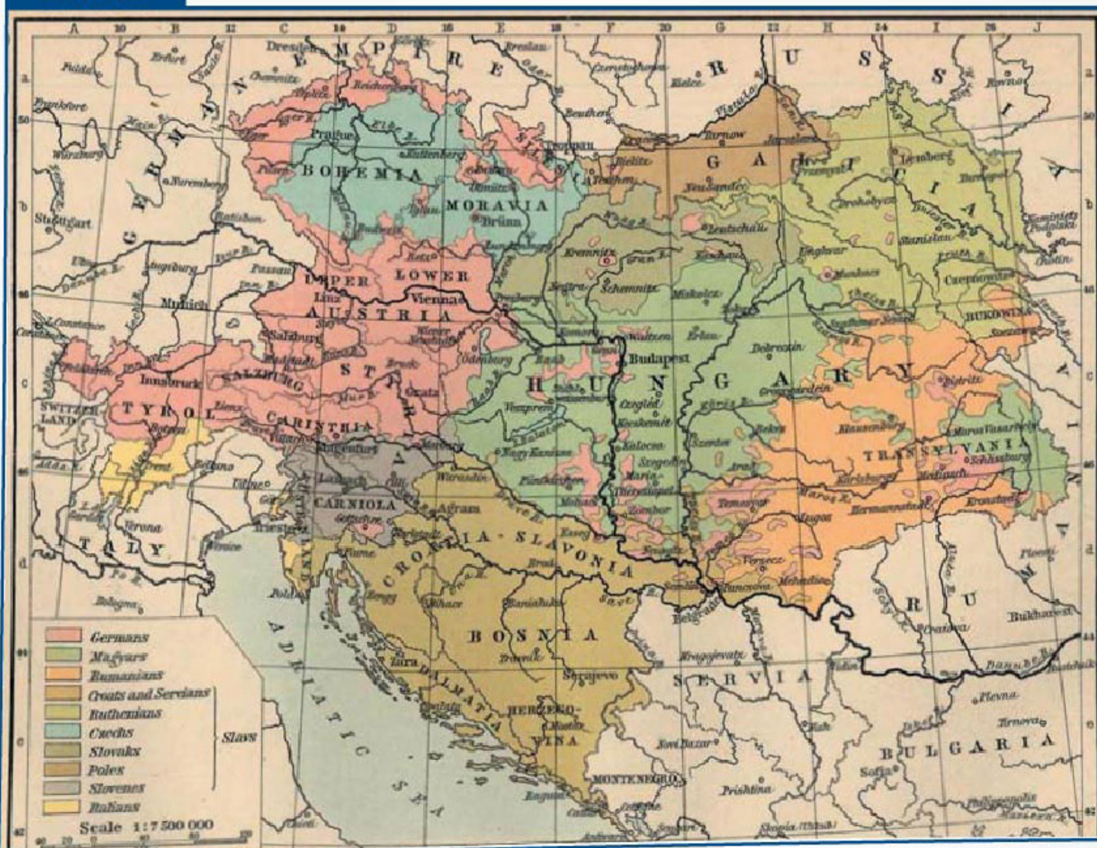
Národnostní mapa habsburské monarchie z roku 1911

1 Jaké národy žily v Rakousku-Uhersku? Jaké národy žily v českých zemích? Jaké národy žily na území, kde se později rozkládalo Československo?