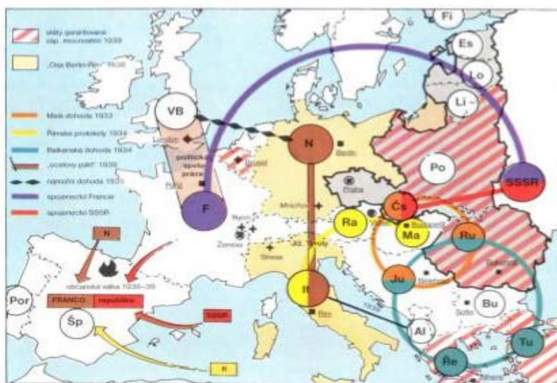
Evropský spojenecký systém 1933–1939